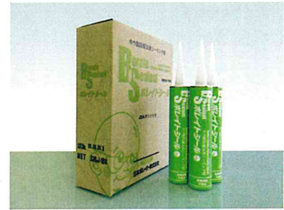
ホウ酸防蟻気密シーリング材 ボレイトシール