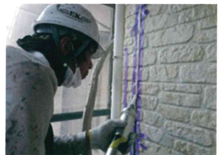
新しいシーリング材を打ち込みます。