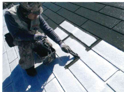
下塗：下地を強化。遮熱性能のある下塗りもあります。