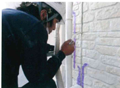
劣化したシーリング材を撤去します。