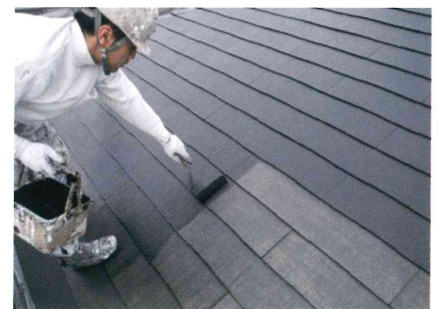
上塗：色を付け屋根を綺麗にし保護します。夏の暑さや冬の寒さにも効果がある遮熱断熱塗料などもあります。