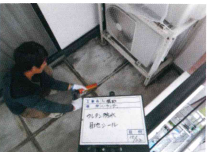
クラック防止と見栄えを良くする為目地部分にシーリングを充填していきます。

バルコニーの防水がしっかりできていないと、そこから建物の中に雨水が入り込み、木材を腐らせてしまいます。最悪ベランダが崩れる事もあります。