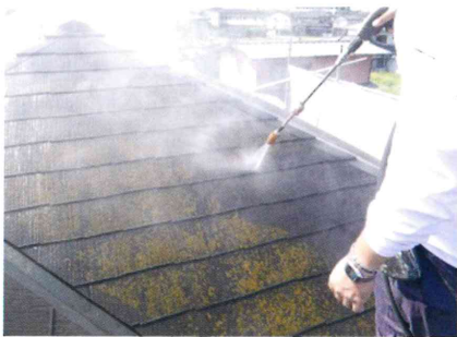
屋根に付着した苔などを高圧水で丁寧に洗淨していきます。

汚れや塗装のはがれ、屋根材の劣化が起きている屋根は、メンテナンスしないでいると、そこから雨水が侵入し中の木材が腐ります。