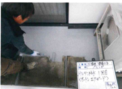
ウレタン防水の1層目を塗布していきます。